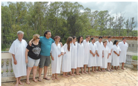
Candidatos ao batismo: dezembro (à esq.) e fevereiro (à dir.)