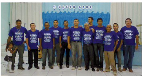
Homens se organizam para realizar um culto ao Senhor

A Igreja precisa, urgentemente, investir, conscientizar e divulgar que a "Família é o Nosso Maior Patrimônio".