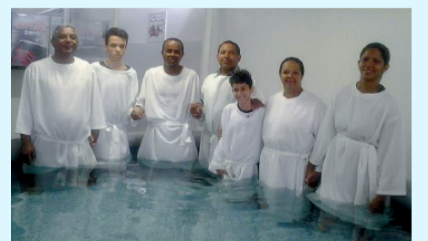
Candidatos ao batismo

Graças a Deus por esta grande vitória no mundo espiritual!