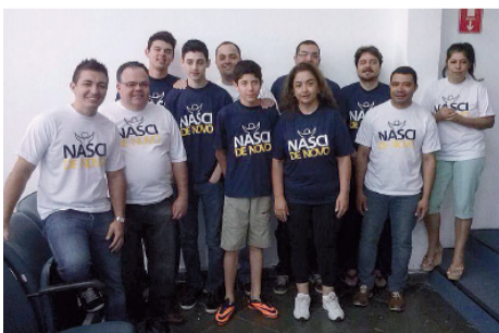
Nova vida em Cristo