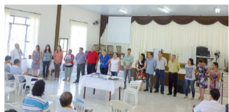
Momento durante Assembleia