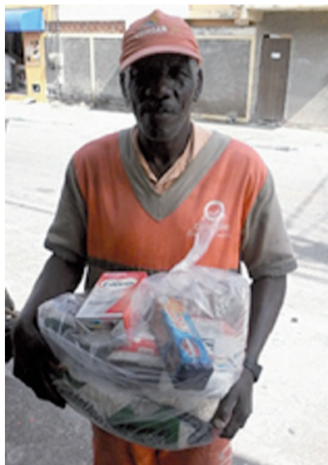
Dia da Solidariedade

A igreja é grata a Deus pelas oportunidades que lhe tem dado e pede sabedoria, unção e ousadia para continuar realizando a obra do Senhor nesse local. Apesar do muito trabalho para 2014, a igreja se posiciona para continuar apresentando ao Senhor todos os resultados de uma vida dedicada ao Evangelho e ao serviço.