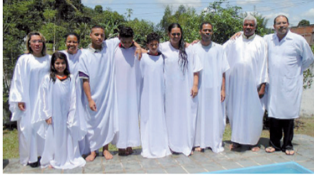
Candidatos ao batismo