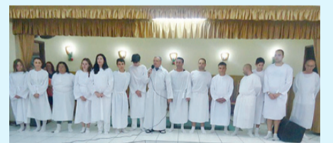
Candidatos ao batismo

São vidas humanas que consideramos importantes e especiais e por isso louvamos ao nosso Pai por elas.