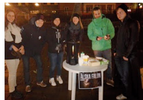
Evangelismo com jovens no centro de Falun