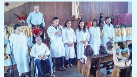
Candidatos ao batismo

São muitas as bênçãos do Senhor e a igreja agradece a Deus por mais essas vitórias.