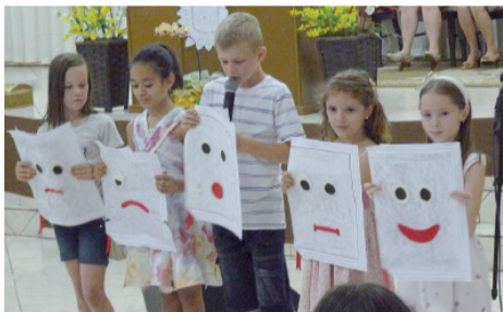
Crianças se apresentam durante aniversário