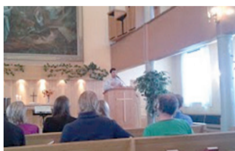
Gagnef - igreja na cidade do primeiro missionário sueco para o Brasil - Erik