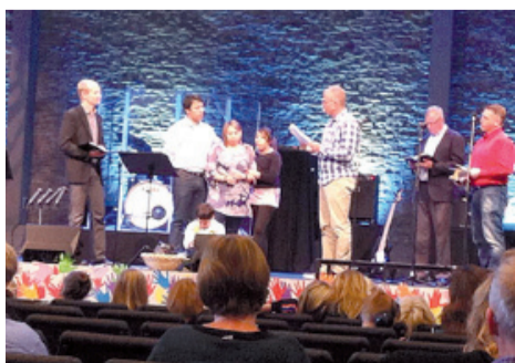
Recepção na igreja em Falun

*Esta carta foi adaptada e você pode ler a mensagem completa do Pr. Silas acessando a nossa página na internet: www.smcibi.org