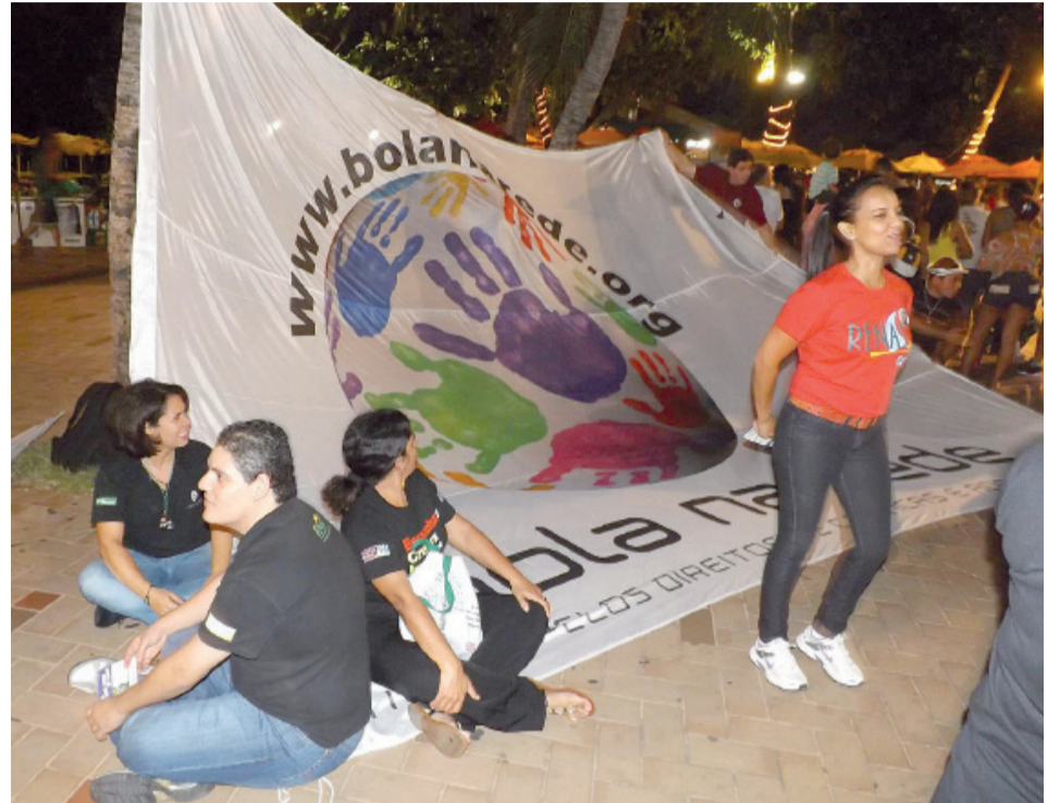
Campanha realizada em setembro na praia em Fortaleza durante o encontro da RENAS

Só não vale não fazer nada! E neste campeonato lutamos todos juntos para (obter, ou conceder) um lugar melhor (socialmente) para as nossas crianças.