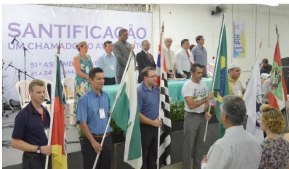
Abertura oficial da 51ª Assembleia Geral da CIBI

mento e dar o tom para o vocal (sem a introdução o vocalista pode entrar fora do tom); a estrofe é o conjunto de versos (uma das seções que compõe a parte cantada); a ponte é a