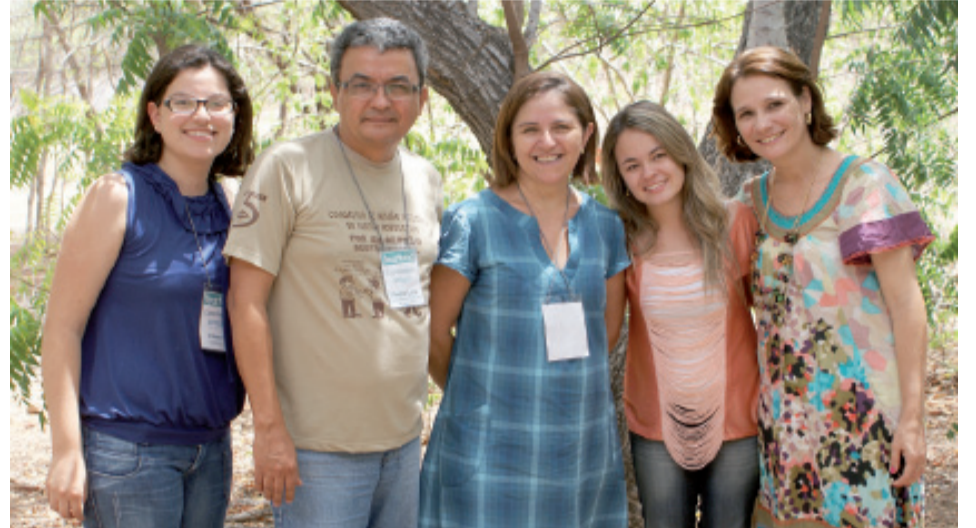
Representantes da FEPAS e da CIBI no treinamento realizado pela Tearfund.