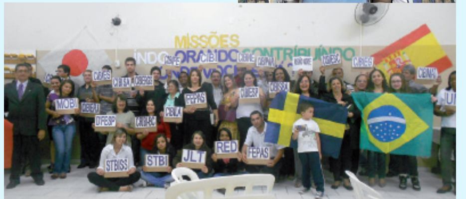
Todos pela causa do Senhor

Em função de problemas técnicos no recebimento de e-mails da editora, nos desculpamos pela não publicação desta matéria na edição de dezembro.