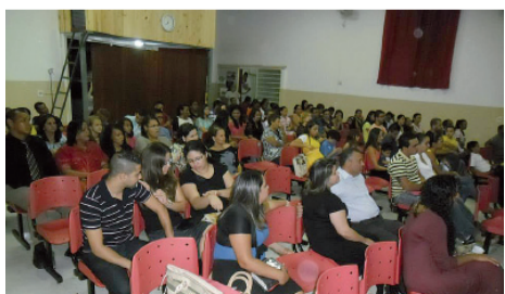
Momento durante o culto

a Tua Obra, ó Senhor", agradece a todos que estiveram presente nestes momentos tão importantes para ela e para o Reino de Deus.