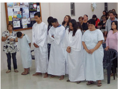
Candidatos ao batismo de agosto