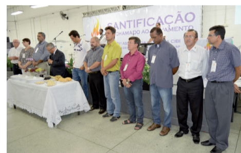
Momentos durante a Ceia do Senhor

A última estrofe foi marcada com a celebração da Ceia do Senhor e a lembrança do sacrifício de Jesus que dá o tom a qualquer boa música. O clima de comunhão entre muitos presentes ajudou no ritmo.