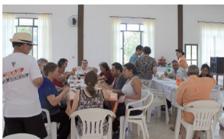
Durante o almoço

A igreja louva agradecida a Deus por suas grandes obras!