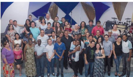
Momentos especiais na presença do Senhor