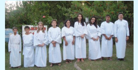
Candidatos ao batismo: 15 de dezembro (à esq.) e 21 de dezembro (à dir.)