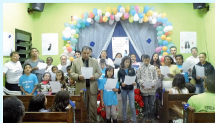
Alguns momentos com as crianças se apresentando